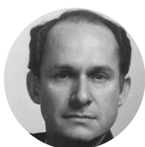
Manuel Elkin Patarroyo Desarrollo científico y tecnológico 1985