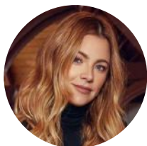
Johana Bahamón Contribución a la niñez, a la paz mundial y a los derechos humanos 2020