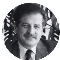
Luis Carlos Galán Asuntos políticos, legales y gubernamentales 1983